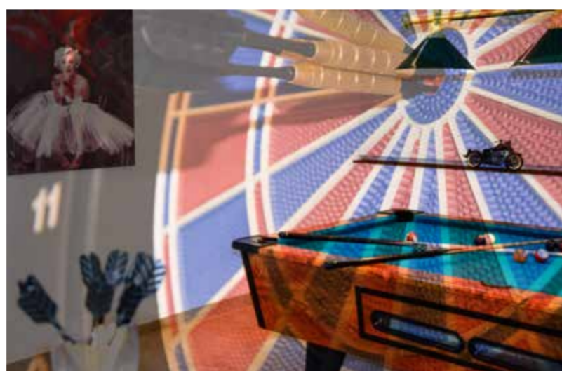
Aufenthaltsraum mit Billard, Darts und Tischfußball. Nutzung gegen Gebühr.

Alle Zimmer sind mit Dusche oder Badewanne, WC, Kabel-TV, Haartrockner, Telefon, Safe und Minibar ausgestattet.